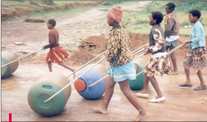
Altadeva guide les porteurs de projets vers les opportunités de développement ou de distribution dans les pays demandeurs. Ici, le Hippo Roller pour un meilleur accès à l'eau.